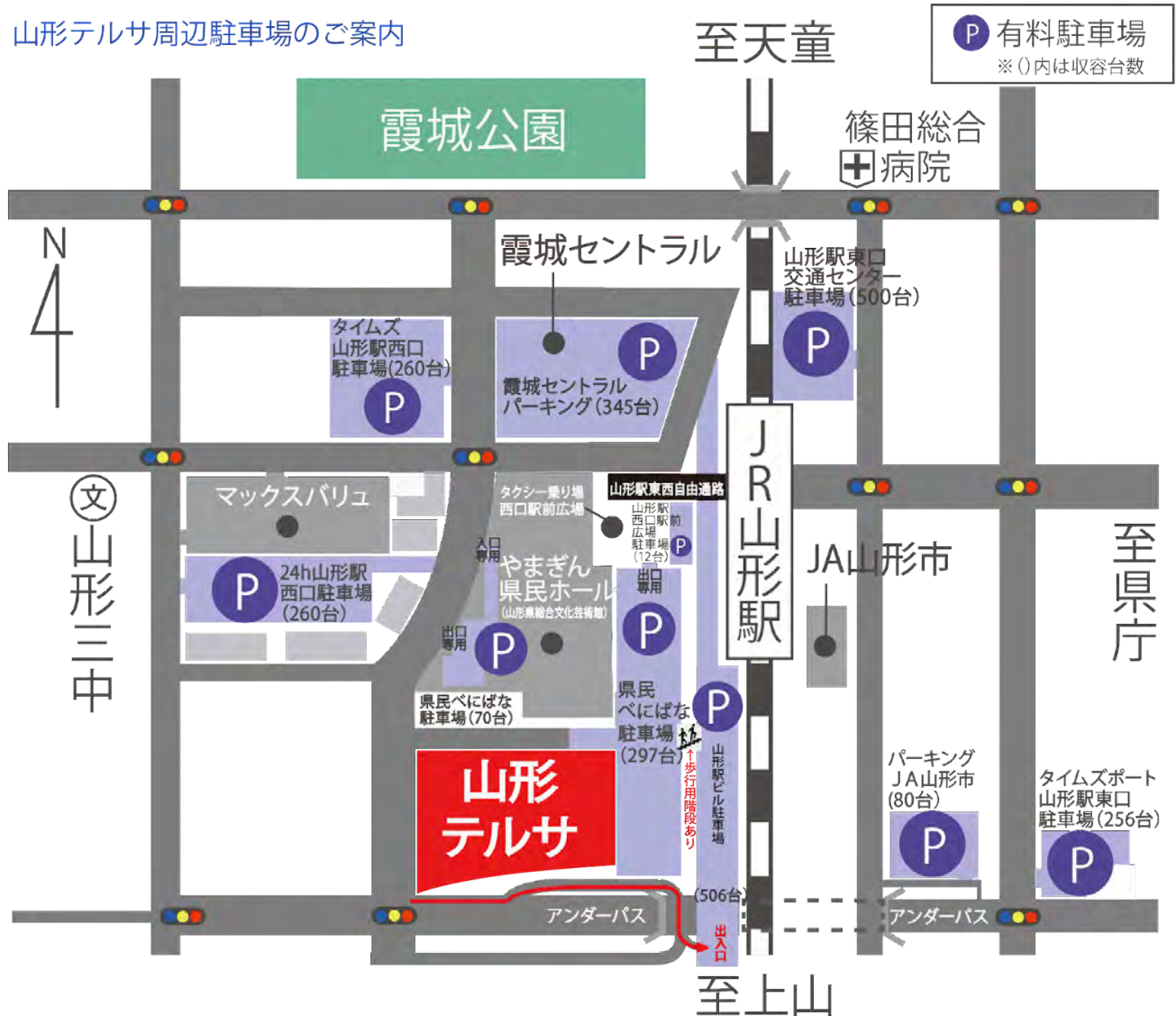
山形テルサ周辺駐車場のご案内

申し込みいただきましたら、当日のZOOMのIDならびにパスワード、参加費の振込先をメールにてご連絡いたします。また、前日までに当日の資料を送付いたします。